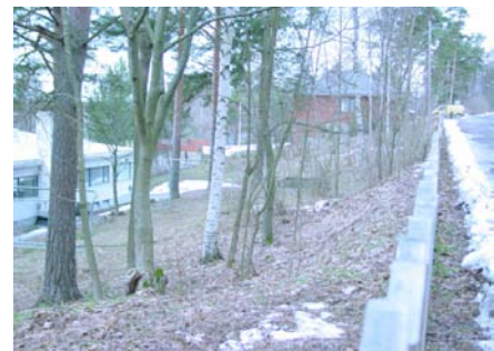
Näkymä Katajatie kevyt väylältä pihaan.

Heikinhovin piha-alueen harjumainen ja luonnon-tilainen maasto pienenee ja mäntyjä joudutaan kaatamaan autopaikoituksen ja rampin tieltä. Pintavesiä imeyttävä maan pinta-ala vähenee. Hulevesien suunnitteluun tulee kiinnittää erityistä huomiota, sillä maankäytön tehostuessa yhteisvaikutukset Tarpilan kanssa saattavat olla tuntuvia sekä pohjavesialueen takia. Pysäköintikansien ja rampin kohdalla maata muokataan voimakkaasti.