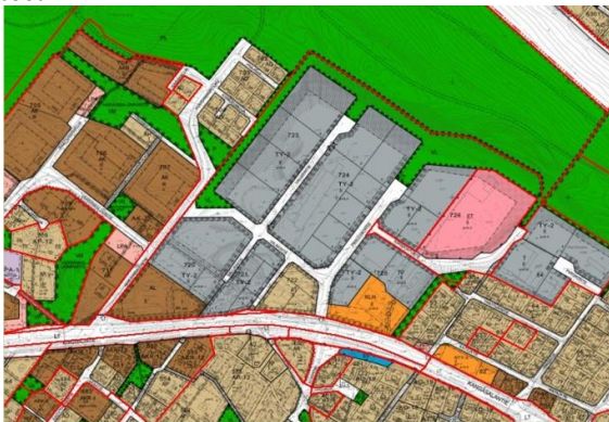
Kuva. Voimassa oleva asemakaava

voimassa olevassa asemakaavassa osoitettu pääosin teollisuusrakennusten tonteiksi. Alueella sijaitsee myös lämpökeskus.