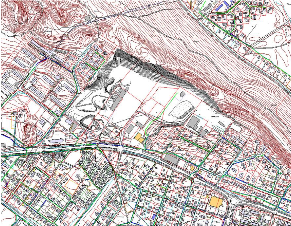
Kuva. Nykyiset rakennukset ja verkostot.

nut aiheutua maaperän likaantumista. Koska alue on tarkoitus muuttaa asuinkäyttöön, asemakaavan laatiminen edellyttää seikkaperäisiä selvityksiä maaperän mahdollisesta saastumisesta.