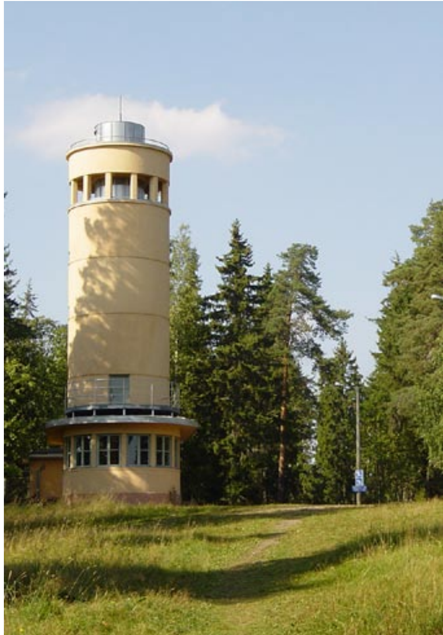
Kirkkoharju, näkötorni, ulkoi- lureitti; Kangasalan viheralu- eiden sydän.

Viheralueet koskettavat jokaista kuntalaista. Koska viheralueet voidaan määrittellä hyvin laajasti, niille on myös monenlaista käyttöä. Suurella osalla asukkaista onkin jonkinlainen näkemys niiden alueiden tilasta – vahvuuksista ja heikkouksista – joita he itse käyttävät. Nämä näkemykset koettiin hyvin tärkeiksi lähdettäessä luomaan tavoitteita Kangasalan kunnan viheralueohjelmalle. Viheralueiden tila koskettaa