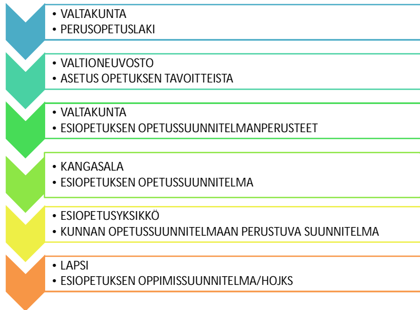
KUVA 1. Esiopetussuunnitelman tasot