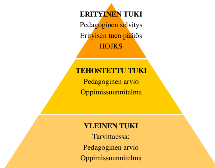
KUVA 1. Kasvun ja oppimisen tuki esiopetuksessa